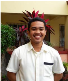
ZIMMER ALDRIN VIOLA I anno - Trasporto marittimo Marine Polytechnic Colleges Foundations, Canaman Progetto di Calabanga, Filippine