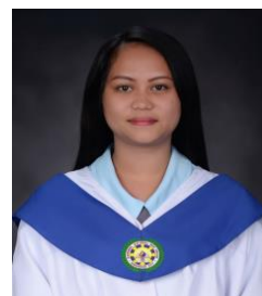
NICHIA GALVANOR AMPARADO II anno – Radiologia North Valley College, Kidapawan Progetto di Manila-Quezon City, Filippine