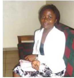
BLANCHE VEJAL NYUYSEM WIYSANNYUY V anno - Medicina Université de Yaoundé Progetto di Yaoundé, Camerun