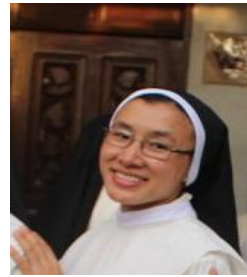
MU LE II anno - Formazione Teologica University of Santo Tomas, Sampaloc Manila Progetto di Manila-Quezon City, Filippine